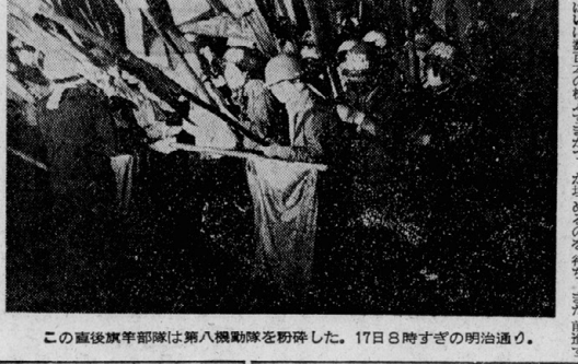
この直後青年部隊は第八機動隊を粉砕した。17日8時すぎの明治通り。

【東京28日電】6月15日、前代未聞の東京一帯に波及した返還粉砕派の統一行動は、宮下公園を占拠する青年部隊の行動と一致し、首都一帯に波及した。この統一行動は、返還粉砕派の統一行動には各大学の全共闘も多数参加した。この統一行動は、宮下公園を占拠する青年部隊の行動と一致し、首都一帯に波及した。