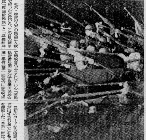
10・12が援見付で突撃寸前の東平部隊。

墨田区で、この日、新たな運動が行われた。学生は、批准阻止の要求を、国政府に強く訴えた。また、学生は、批准阻止の要求を、国民に訴えるため、各所で、署名運動や、演説を行った。このデモ行進は、学生連帯の中心組織である「学生連帯」が中心となり、全国の学生が参加した。