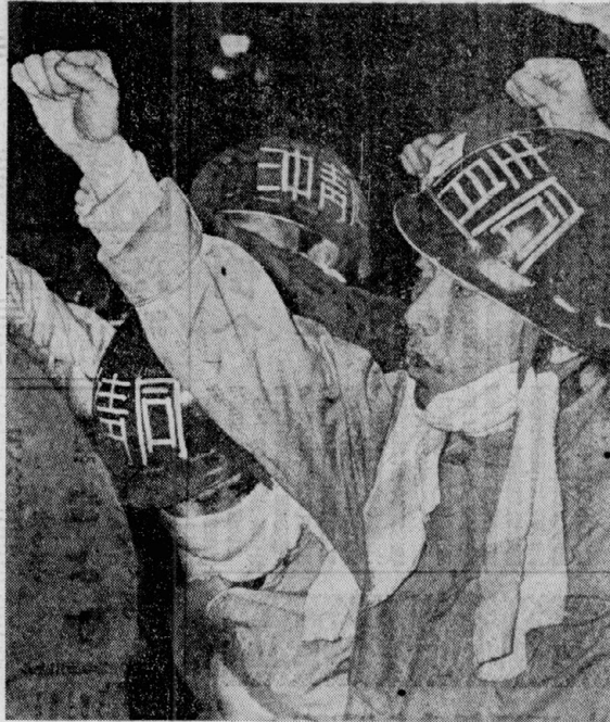
3名の行動隊の国境突入によって批准阻止の突破口を開いた沖青岡の隊列

「飛躍か、すんば死」という言葉が、この日、学生の間で流行した。学生は、批准阻止の要求を、国政府に強く訴えた。また、学生は、批准阻止の要求を、国民に訴えるため、各所で、署名運動や、演説を行った。このデモ行進は、学生連帯の中心組織である「学生連帯」が中心となり、全国の学生が参加した。