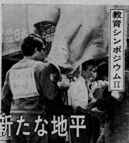
教育シンポジウムII 「教育の高度化と質」をテーマに、各界の専門家らによる熱い議論が展開された。