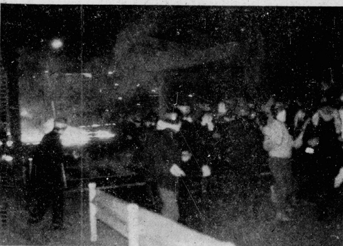
駒場から出陣した部隊は、渋谷駅近くで激戦した。19日午後

十九日午後、東京都内各所で激戦が展開された。沖共闘は、一拠点から出撃し、都内各所で実力攻防戦を展開した。労働者への礫川公園から、自民党、衆院採決を強行する日比谷公園で激闘が展開された。返還粉砕闘争阻止は、十九日午後、東京都内各所で激戦が展開された。沖共闘は、一拠点から出撃し、都内各所で実力攻防戦を展開した。労働者への礫川公園から、自民党、衆院採決を強行する日比谷公園で激闘が展開された。