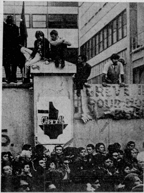
労働者に占拠、自主管理されている工場—68年5月、パリ

戦後世界の激動の環は、植民地解放闘争の衝撃によって形成された。第二次世界大戦の終結後、植民地国家の独立運動が世界的な規模で展開され、国際情勢に大きな変革をもたらした。この動きは、冷戦構造の形成や第三世界の台頭と深く結びついており、現代の世界政治の基盤を形作る重要な要素となっている。