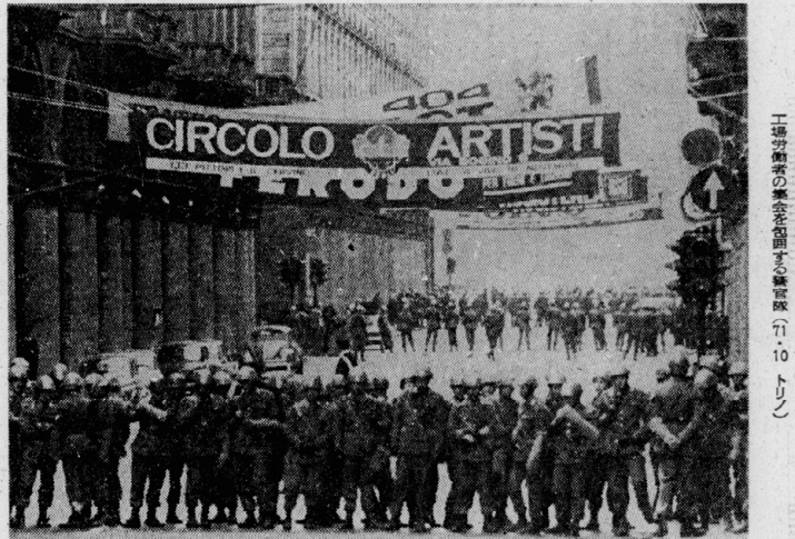
トリノ市街をデモするアナキストの工員たち (71・10)

イタリア階級闘争の激化は、秋の到来と共に、ますます激化してきている。前回は、トリノ市街を襲った暴徒の姿、そして、その背後に隠れた階級闘争の構造を、本誌上で取り上げた。今回は、その背後に隠れた階級闘争の構造を、本誌上で取り上げる。