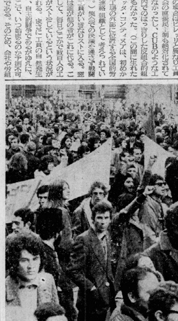
トリノ市街をデモするアナキストの工員たち (71・10)

イタリア階級闘争の激化は、秋の到来と共に、ますます激化してきている。前回は、トリノ市街を襲った暴徒の姿、そして、その背後に隠れた階級闘争の構造を、本誌上で取り上げた。今回は、その背後に隠れた階級闘争の構造を、本誌上で取り上げる。