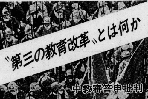
「第三の教育改革」とは何が 中教審答申批判

資本総司令部に集中攻撃を、目標はますます明らかに。これは、労働運動の発展と、階級的前衛党の建設の両方を同時に進めようとするものである。これは、労働運動の発展と、階級的前衛党の建設の両方を同時に進めようとするものである。これは、労働運動の発展と、階級的前衛党の建設の両方を同時に進めようとするものである。