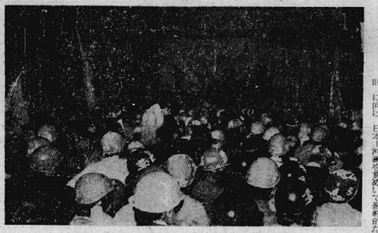
28日、日比谷野音に5000人を結集した沖共闘集会