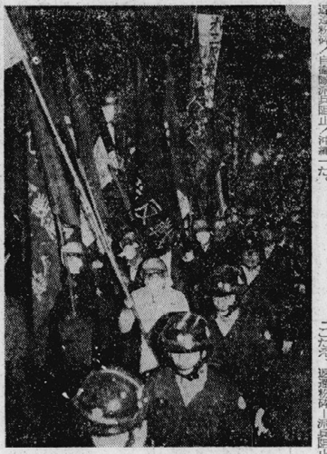
六本木をデモする沖共闘の隊列

沖共闘は、五月五日の式典に反対する学生、市民の総力を挙げて、日比谷野音に五千人を集結し、式典の粉碎を叫びました。