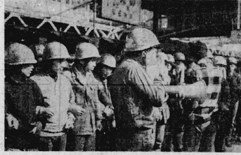
27日、上野駅で国労高松地本青年部との連帯集会をもちとる学生

沖繩最終決戦の勝利へ。この勝利は、沖繩最終決戦の勝利へ。この勝利は、沖繩最終決戦の勝利へ。この勝利は、沖繩最終決戦の勝利へ。この勝利は、沖繩最終決戦の勝利へ。