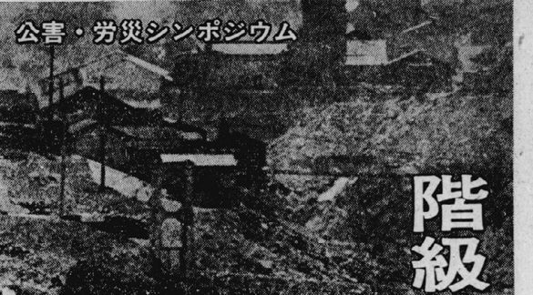
公害・労災シンポジウム

カラコンパの御相談 承ります。 割烹 きよす 株式会社キョウキョウ 京大構内出川上ル TEL (075)2111-1111