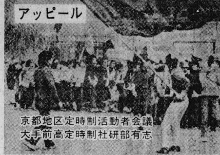
京都地区定時制活動者会議 大手前高定時制社研部有志