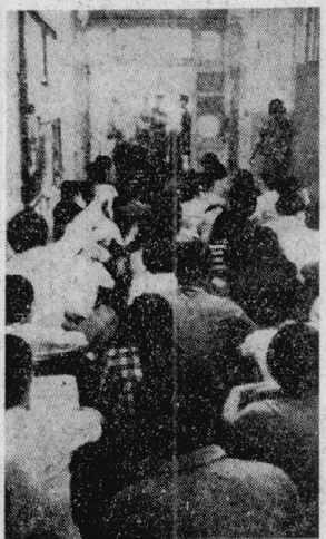
七月一日、大政市役所民生局前にすわりこみ民族差別行政を糾弾する関西徐支連の隊列