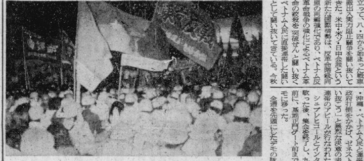
9・2相模原で結決闘集会を貫徹する労働者・学生

八月二十四日の朝、日比谷公判闘争の第一日となる。九月公判は16、19日の両日に予定され、6鑑定書の採否をめぐり決定的な闘いになることが予想される。この決定的な闘いを知り、学生運動・労働者運動の「差別主義的・本工主義的・階級を突破し、京都大学の闘いと結合し、現場における反合理化闘争・学生連帯の教育運動を背景として闘いの高揚をもつての圧倒的な決戦が展開されている。