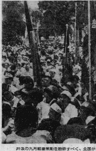
評級の九月結審を期すべく、全国から結集した五千人の都庁大衆、労働者、学生