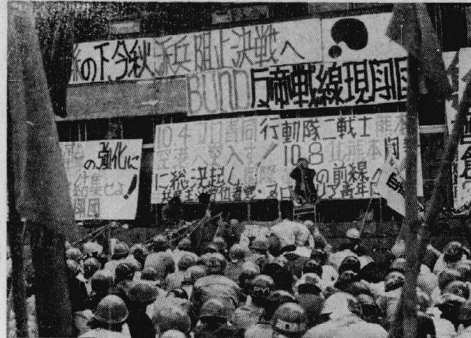
熊本大学生会館前に結集した沖共闘の部隊

十月十日、熊本県熊本市で、熊本県学生連合会(熊本学連)が主催する「全国一斉基地闘争」の集会が開かれた。熊本学連の代表は、この集会で、全国の学生連合会に呼びかけ、同日、全国の基地闘争を同時に行うよう求めた。