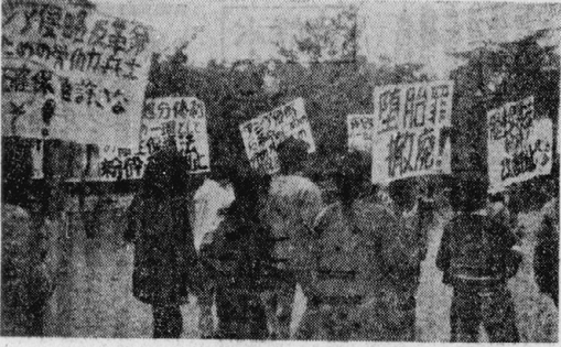
優保法改悪に反対する学生(山公園)

10月15日午後、山公園で「優保法」改悪阻止を叫ぶ学生が約100人集結した。学生らは、政府の優遇保護法改悪案に反対し、大規模なデモを行った。参加者らは、デモの最中に「優保法改悪反対」「学生自治会」などのプラカードを掲げ、叫び声を上げて抗議した。