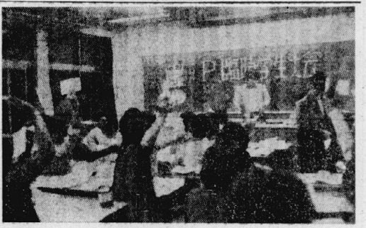
結集に時間延長のみを認る自治委員会をリコール (教育学部学生大会)

10月10日、相模原市で約3000人の学生と労働者が集結し、総評青年協関東ブロック集会を開催した。集会では、学生自治会幹部らが、階級的労働運動の重要性を説明し、労働者と学生との連帯を訴えた。また、学生らは、政府の改悪案に反対し、大規模なデモを行った。集会では、学生自治会幹部らが、階級的労働運動の重要性を説明し、労働者と学生との連帯を訴えた。