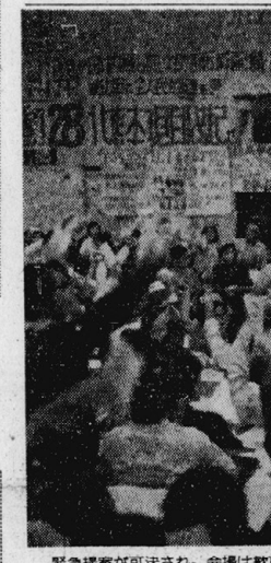
緊急提案が可決され、会場は歓声に包まれた。10・18教養部代議員大会

十月八日教養部代議員大会で、波状ストに突入す。緊急提案可決さる。十月八日教養部代議員大会で、波状ストに突入す。緊急提案可決さる。