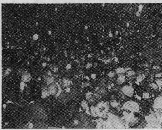
機動隊の規制に抗し、シゲザグデモを貫徹する全学連・反戦 (10・21京都一沖共闘集会)

ベトナム戦争の激化と、チェー政権との「詰め」の会議を背景に、ベトナム革命の「和平」をとおした反戦闘争が現実のものとなる。一方「社会主義」を掲げた「新反戦」が、10・21国際反戦闘争を推進する。10・21国際反戦闘争は、民主連合政府下、公然たるファシストの権威が迫ったチリ、資本主義の生産様式を一時的に制約するこの世界の赤旗な反戦闘争も新たな段階を示している。