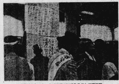
釜ヶ崎労働者センター内で労働者に話を聞いた釜ヶ崎調査団。

釜ヶ崎労働者センターは、労働者たちの生活改善を目的として設立された。センターでは、労働者たちの生活状況を調査し、社会に報告することを目的としている。センターの活動を通じて、労働者たちの生活改善に貢献したいと述べた。