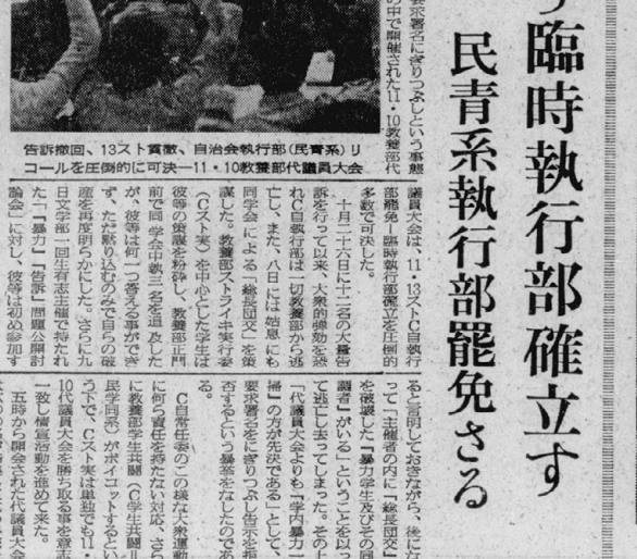
告知撤回、13又ト真意、自治会執行部(民青系)リコールを圧倒的に可決—11、10教養部代議員大会

【本報記者 吉田 昭一】教養部臨時執行部は、11月4日、民青系執行部を罷免し、臨時執行部を確立した。戦車を搬送させず、65時間の臨戦態勢で闘った。