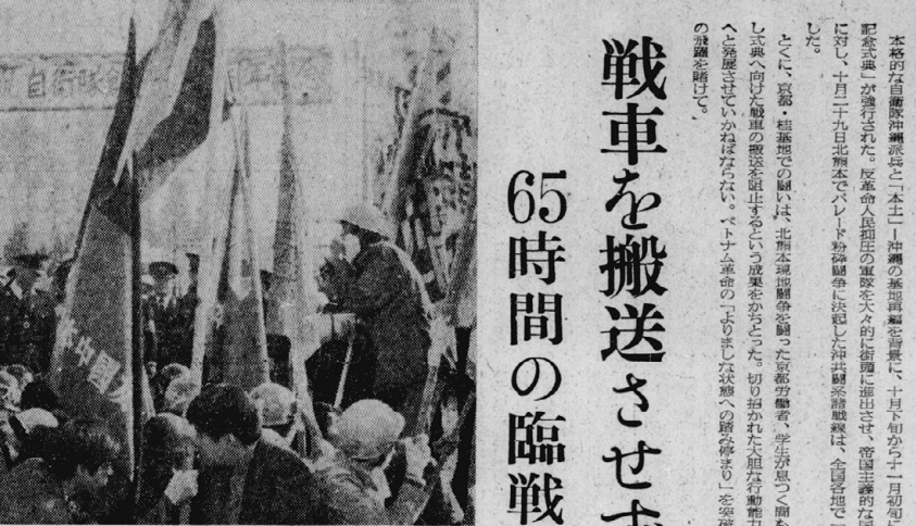
11月4日、自衛隊祝賀式典に抗議して、官舎の陣地はねのけ桂基地正門前で座り込みを貫徹する隊列