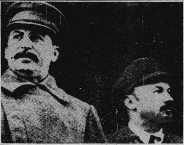
五よりスターリン、プハーリン(当時コミンテルン議長、1927年)