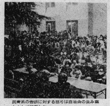
民青系の密謀に対する区別は自治会の生み出しとして結果した。

執行部(民青)をリコール 闘う学生自治会の創出へ 六年間続いた、七年度後援会以来、京大生連合会(以下「生連会」)の執行部(民青系)が、学生自治会(以下「自治会」)の創出を目的として、全学学生大会を開催した。大会は、出席者2976名、賛成者2588名という大規模な集まりで、執行部のリコールと自治会の創出を決議した。 生連会執行部は、長年にわたって、学生自治会を創出しようとする学生たちの要求を拒否し、民青系が中心となって運営されてきた。この大会では、学生たちは、執行部のリコールを求め、新しい学生自治会を創出することを決意した。 大会は、11月27日、京大講堂で開催された。出席者は、全学学生大会の開催を呼びかけた学生自治会(以下「自治会」)の創出を目的として、全学学生大会を開催した。大会は、出席者2976名、賛成者2588名という大規模な集まりで、執行部のリコールと自治会の創出を決議した。