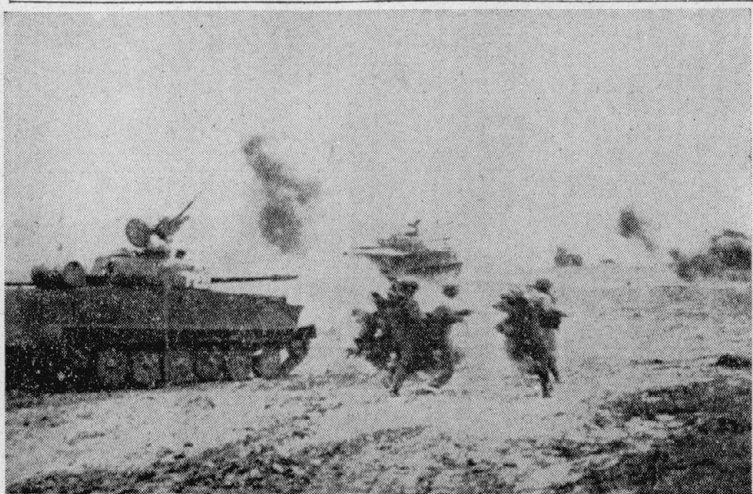
72年春、ベトナム武官解放勢力の大攻勢クアンチ省での戦場