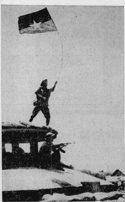
ドンハ制圧、南ベトナム臨時革命政府の旗を掲げる解放軍兵士 (72年3月)

アジア的村落共同体は、スターリニズムの基礎に形成されている。これらの共同体は、階級闘争の本質を捉え、労働現場と学生現場を結びつけることを目指している。ソヴェイト運動は、これらの共同体を基盤として展開している。