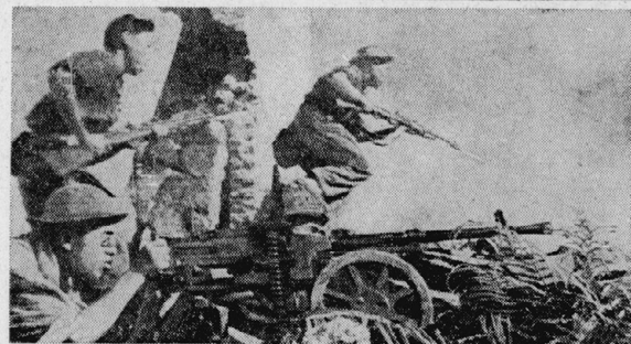
ユエ市を攻撃する解放軍—68年2月、テト攻勢

ソヴェイト運動の展開は、スターリニズムの根底的止揚を必要とする。スターリニズムは、階級闘争の本質を歪曲し、労働運動を労働組合の枠組みに限定しようとする。ソヴェイト運動は、この歪曲を正し、階級闘争の本質を捉え、労働現場と学生現場を結びつけることを目指している。