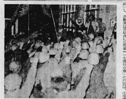
交運ゼネスト実施の瞬間。乗客は驚き、乗務員は冷静に業務を遂行している。背景には、都市の風景が写り込んでいる。

【本報記者 東京七日電】日本列島を震撼させた、交運ゼネストは、今日(七日)正午、全国で同時に実施された。このゼネストは、三月の間に、交運関係の労働組合が、政府に交渉を求めたにもかかわらず、交渉がまとまらなかったため、実施された。このゼネストは、三月の間に、交運関係の労働組合が、政府に交渉を求めたにもかかわらず、交渉がまとまらなかったため、実施された。 このゼネストは、三月の間に、交運関係の労働組合が、政府に交渉を求めたにもかかわらず、交渉がまとまらなかったため、実施された。このゼネストは、三月の間に、交運関係の労働組合が、政府に交渉を求めたにもかかわらず、交渉がまとまらなかったため、実施された。