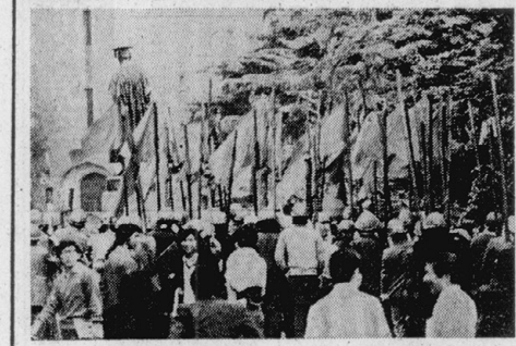
4・21大塚前で行われた「文学大勝利総決起集会」