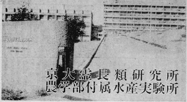
京大霊長類研究所 農学部附属水産実験所