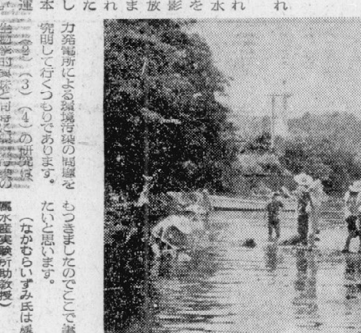
昨年夏の臨海実習の様子

【原】 原発建設に伴う漁業災害の問題が、社会の注目を集めています。本実験所では、この問題について調査研究を行っています。最新の研究成果を、本報を通じて広く読者に紹介したいと思います。