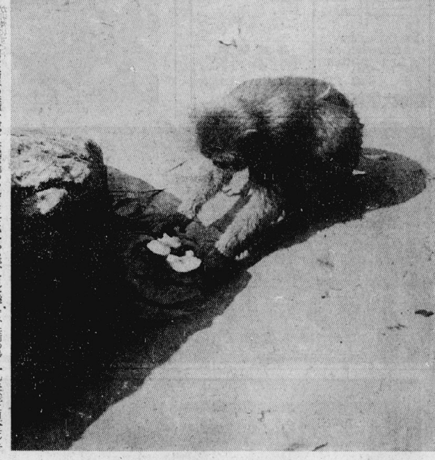
サルでイモ洗いをするサル