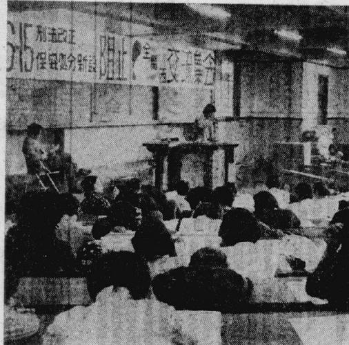
第一回全国患者集会の様子。参加者は約五百名に上り、予備罪の新設と秘密警察の強化に反対する声援を述べた。

【本紙記者東京二十四日電】「第一回全国患者集会」は、二十四日午後六時、東京・有明コロシアムで開かれた。参加者は約五百名に上り、予備罪の新設と秘密警察の強化に反対する声援を述べた。