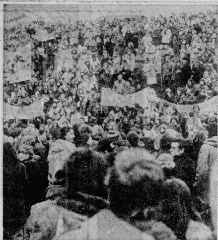
3万をこえる大集会 (ブロックドルフ)

フランス、西ドイツの環境・農民運動は、その論理を述べた。その論理は、環境と農民運動の結合を訴えている。この論理は、環境と農民運動の結合を訴えている。この論理は、環境と農民運動の結合を訴えている。