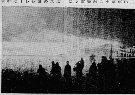
機動隊による放水 (ブロックドルフ)

パリッ子も反対運動に参加している。すでに汚染の影響が認められている。この反対運動は、パリッ子の健康を守るために行われている。この反対運動は、パリッ子の健康を守るために行われている。この反対運動は、パリッ子の健康を守るために行われている。