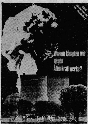
農学部 市川助手に聴く タイトルバックはブロックドルフの闘争を伝える アルハイターカンペ誌