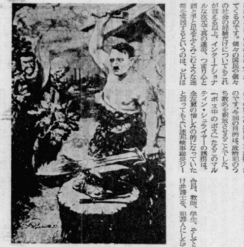
ツァール「武器としての批評」より

「機動隊の暴力は氷山の一角」といふのは、 ... (text continues) ...」