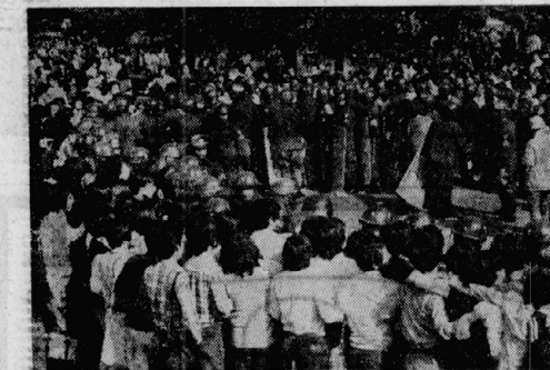
「武器としての批評」より