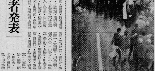
七七年入寮者発表