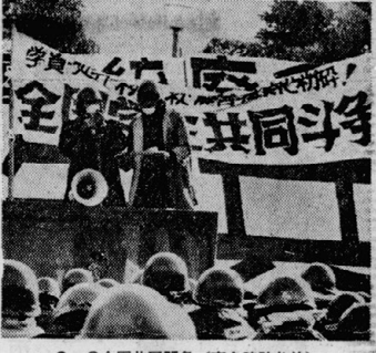
2・6 全国共同闘争 (京大時計台前)