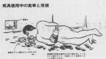
戒具使用中の食事と用便

「代用監獄・人格改造を許すな」を掲げ、現行の監獄法を批判する京大刑事法研究会の活動が、最近ますます活発化している。研究会は、このたびは、代用監獄・人格改造を許すなをテーマに、大規模なデモ行進を行った。研究会は、このデモ行進を機に、代用監獄・人格改造を許すなをテーマに、大規模なデモ行進を行った。