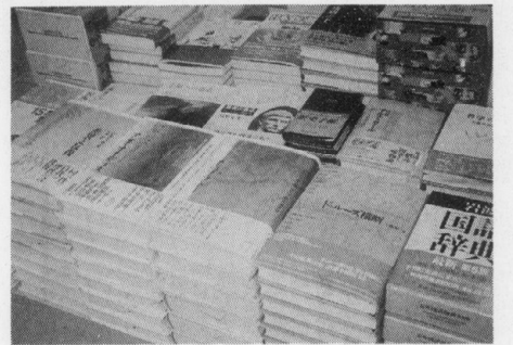
▲書店の店頭で (協力・京大生協西部会館ルネサンス書庫)

「ドゥルーズ横断」は、ドゥルーズの思想を断片的に紹介するのではなく、断片を断片として読むという姿勢が、本書の大きな特徴である。ドゥルーズの思想は、断片である。断片を断片として読むという姿勢が、本書の大きな特徴である。断片を断片として読むという姿勢が、本書の大きな特徴である。