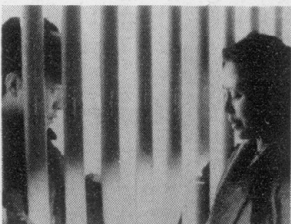
▲グラブプリに輝いた「息子の告発」