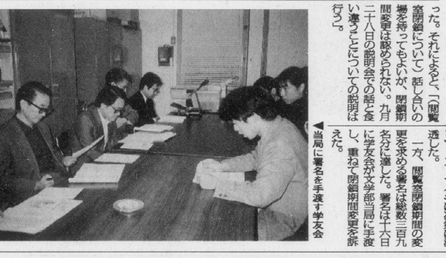
▲閲覧室を手控えた学友会

文学部は九月二十八日の閉鎖期間の一方の決定を撤回することを求め、学友会と団交を要求する。また、閲覧室の閉鎖期間の変更も要求している。学友会は、閉鎖期間の変更を拒否したため、学友会と団交を要求している。また、閲覧室の閉鎖期間の変更も要求している。学友会は、閉鎖期間の変更を拒否したため、学友会と団交を要求している。また、閲覧室の閉鎖期間の変更も要求している。