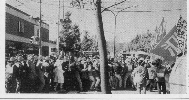
▲学生一人一人の過労死

戒厳令下の京都市内。天皇入洛の裏で。これは、学友会と団交を要求している。また、閲覧室の閉鎖期間の変更も要求している。学友会は、閉鎖期間の変更を拒否したため、学友会と団交を要求している。また、閲覧室の閉鎖期間の変更も要求している。学友会は、閉鎖期間の変更を拒否したため、学友会と団交を要求している。また、閲覧室の閉鎖期間の変更も要求している。