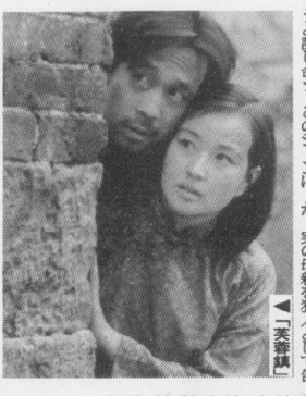
▲「舞臺」の主演、片岡仁左衛門

今年も、京都府京都市中京区に於いて、第七回京都国際映画祭が盛大に開催された。開催期間中は、市内各所に映画祭のポスターが掲げられ、市民の注目を集めた。また、市内各所に映画祭のポスターが掲げられ、市民の注目を集めた。また、市内各所に映画祭のポスターが掲げられ、市民の注目を集めた。