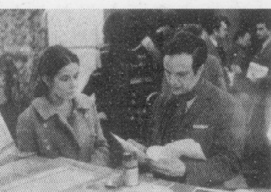
▲トリュフォーの映画人生 (二九五)

これはすべて真実の物語です。 わたしは事実を土台にしてシナリオを書き、 何の創作もしていないのです。 強く激しい情熱の物語は、 『恋のエチュード』以来わたしの心を魅惑しているテーマです。 ——フランソワ・トリュフォー——