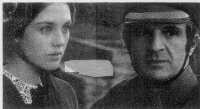
▲トリュフォーの映画人生 (二九五)

トリュフォーの映画人生は、特異なものであった。『トリュフォー ある映画的人生』は、著者山田宏一氏が、トリュフォーの映画人生を追ったものである。トリュフォーの映画人生は、特異なものであった。『トリュフォー ある映画的人生』は、著者山田宏一氏が、トリュフォーの映画人生を追ったものである。