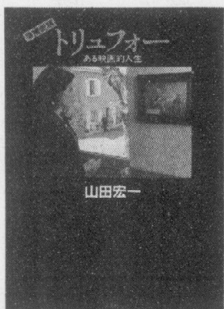
著・山田宏一 平凡社・2800円