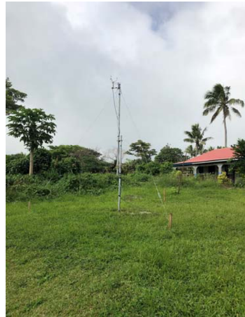
Photo 1 Ultrasonic anemometer installed in Vanuatu

計測システム完成後、バヌアツにおいて計測システムを設置した。設置後の超音波風速計、データロガーの写真をPhoto 1, Photo 2に示す。データロガーは、故障した時のために予備機を用意した。データロガーの交換作業は現地居住者に依頼した。この現地作業担当者は計測装置を扱った経験がないため、交換作業は出来るだけ簡易で、分かりやすくする必要があった。コネクタを間違えて接続しないよう、それぞれのコネクタの形を変える、コネクタの数を出来るだけ少なくする、スイッチなどは使わず、コネクタを差すだけで起動するなどの工夫をした。