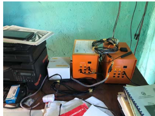
Photo 2 Measuring device installed in Vanuatu (White box is data logger and orange box is battery).