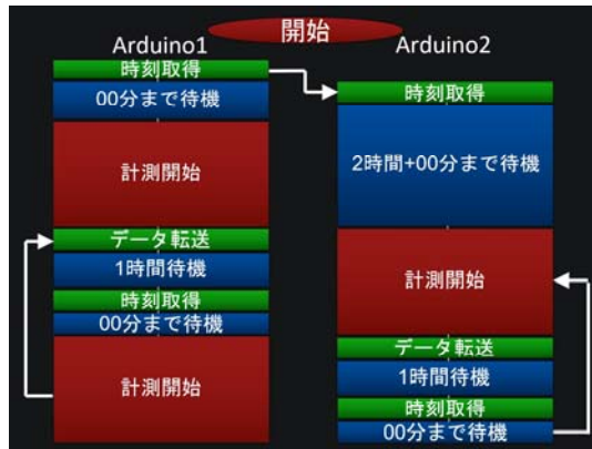
Fig. 2 Flowchart of two micro-computers.