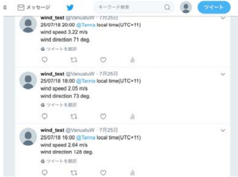
Fig. 3 Wind data sent to SNS (twitter)