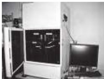
動物用光イメージング装置