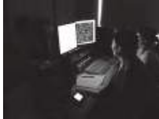
DNA損傷応答モニタリングシステム