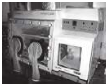
低酸素細胞培養装置