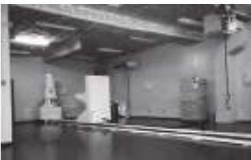
低線量長期放射線照射室