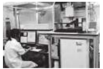
放射線・薬剤応答自動記録システム