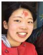
お祭りのティカをつけて