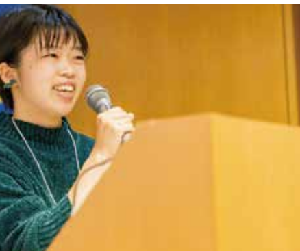
女子高生・車座フォーラムで講演