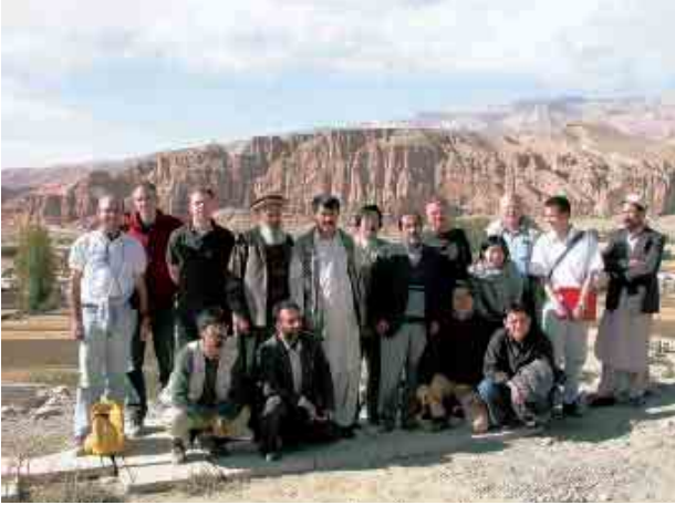
アフガニスタン、パーミヤンの石窟仏像（背後の崖）の調査グループ

コ世界遺産の最も代表的なものであることから、ペルー国内だけではなく、広く世界的に注目されており、ユネスコ等の国際機関だけではなく、イタリア、チェコ、スロバキア等から地すべり専門家が本プロジェクトに参加してペルーの文化庁、自然資源庁、地質金属研究所、地球物理学研究所、クスコ大学等とともに国際的な研究交流、技術移転のためのフレームワークが形成されてきている。さらに2002年からはUNITWIN networkのうち、特にイタリアのグループが核となり、アフガニスタンのタリバンに破壊されたパーミヤンの石窟仏像の不安定性評価と対策工についての検討を日本の信託基金等を得て推進している。