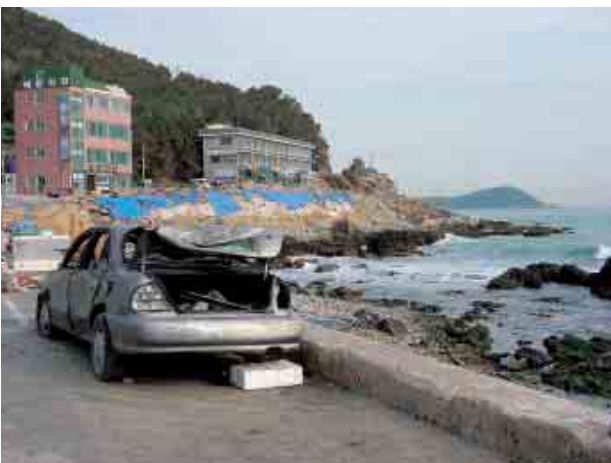
写真3 修復中の海岸道路

カラオケボックスには多くの人たちが集まっていた。海岸から800mも離れており、そこに来ていた人たちと従業員はまさかここまで海水が来るとは思わなかったそうである。水が地下に入った時も営業中だった。この時の浸水で8名の方がなくなり、その中には結婚を約束した2人が含まれていた。この娯楽施設では火事の対策はしていたが高潮の対策はしていなかった。それに対して隣のビルでは地下に店舗を開いている居酒屋のオーナーが、自らの判断で止水板を設置していたため被害を免れている。ソウルに訪れた際に地下鉄の入り口にもやはり止水板が置かれていた。この止水板が命運を分けたわけである。またこの町には近くの貯木場から流れ出した多量の丸太が散乱し、道路を埋め尽くして危険な状態となっていた。また丸太によってショーウィンドウのガラスが割れた建物もあった。