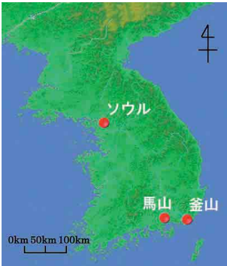
図1 釜山と馬山の位置（カシミール3Dにより作成）

写真1は、海上ホテルの転覆現場である。埋立地の港湾内に係留したロシア製の船をホテルとして利用したものだ。2003年から営業を開始していたが、被災時から約3ヶ月経った調査当時では100億ウォン（10億円）の被害で復旧の見通しが立っていなかった。不幸中の幸いで、ホテルにいた人たちは避難して犠牲者はでなかった。台風が韓国に上陸する直前の最大風速は60m/sであった。そして転覆したのはそのすぐ後の出来事である。また近くのマンションの1階部分が浸水したが住民は小・中学校に避難し事なきを得た。