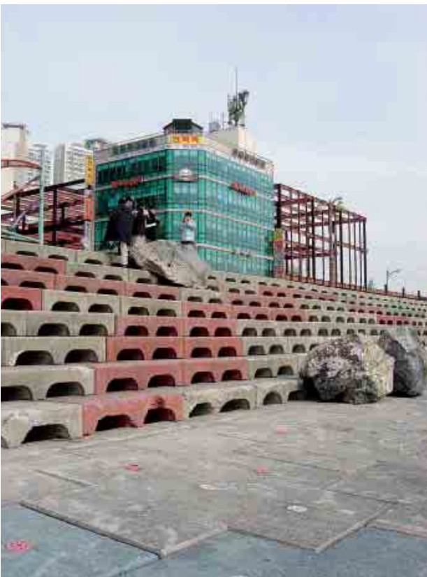
写真2 ミラク水辺公園