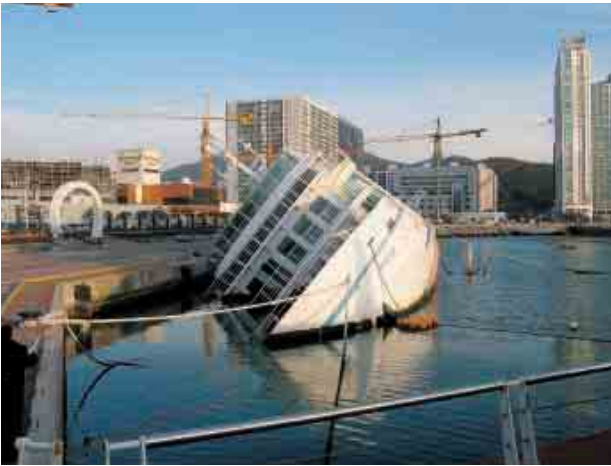
写真1 海上ホテルの転覆現場