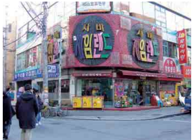
写真4 馬山の娯楽施設

カラオケボックスには多くの人たちが集まっていた。海岸から800mも離れており、そこに来ていた人たちと従業員はまさかここまで海水が来るとは思わなかったそうである。水が地下に入った時も営業中だった。この時の浸水で8名の方がなくなり、その中には結婚を約束した2人が含まれていた。この娯楽施設では火事の対策はしていたが高潮の対策はしていなかった。それに対して隣のビルでは地下に店舗を開いている居酒屋のオーナーが、自らの判断で止水板を設置していたため被害を免れている。ソウルに訪れた際に地下鉄の入り口にもやはり止水板が置かれていた。この止水板が命運を分けたわけである。またこの町には近くの貯木場から流れ出した多量の丸太が散乱し、道路を埋め尽くして危険な状態となっていた。また丸太によってショーウィンドウのガラスが割れた建物もあった。