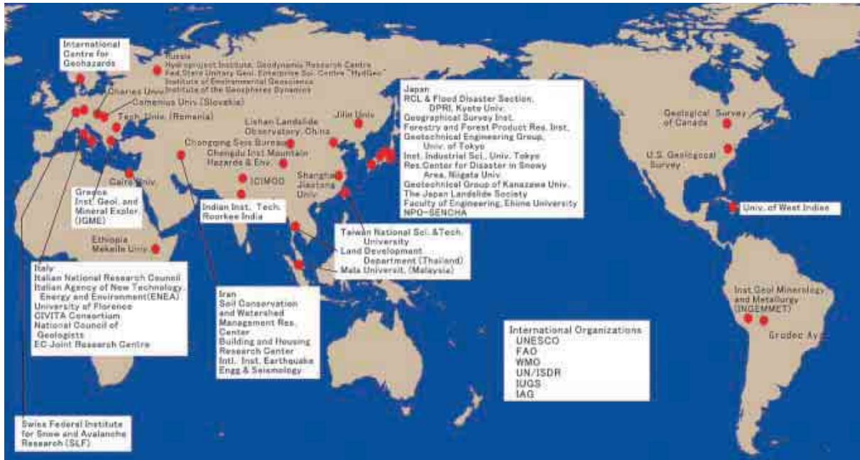
UNITWINに参加するICLの49機関（平成16年3月現在）