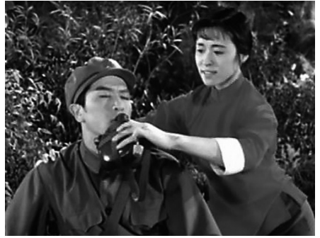
図11 革命現代バレエ『沂蒙頌』。 自らの母乳を水筒で兵士に与える英嫂

ず、生死も不明である。 *29 この「不在の夫」の表象は、一九七五年に映画化された革命現代バレエ『沂蒙頌』 *30 にも見ることができるといえる。