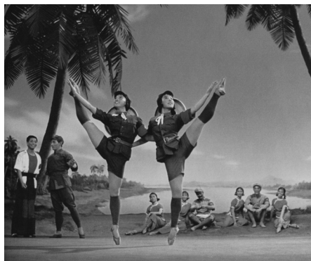
図10 革命現代バレエ『紅色娘子軍』

さらには、劉文兵が革命模範劇『海港』を例にあげて指摘 するように、模範劇の女性像には改作の指揮をとった江青の 自画像が投影されている(劉文兵 二〇〇四・一六六―一七 一)。実は江青こそ、『紅色娘子軍』に先駆けて花木蘭の系譜 になぞらえられた革命戦士なのであり、一九三九年、「江 青」ことかつての上海の女優藍蘋と毛沢東の結婚を伝える新 聞記事には、軍装し敬礼する彼女の写真が、「旧時の旗袍 を脱ぎ、紅軍の制服を着て、愛する前髪を犠牲にして雄々し い紅星の帽子をかぶり、その様子は雌雄見分けがたく、まる で現代の花木蘭である」と報道される(冷芳一九三九)。