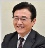
湊 長博 京都大学理事