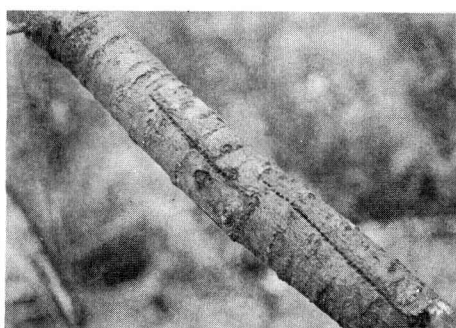
ネコヤナギにつけられたイタヤカミキリの産卵痕