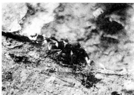
丸太上のクビアカトラカミキリ