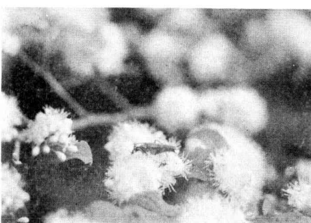
サワフタギ花上のクロズジハナカミキリ