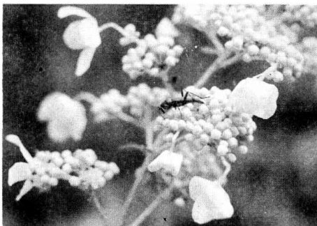
ノリウツギに来たフタオビミドリトラカミキリ