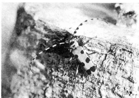
丸太上を歩くルリボシカミキリ