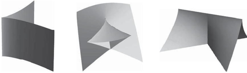
図1 カスプ辺 (左), ツバメの尾 (中央), カスプ状交差帽子 (右)