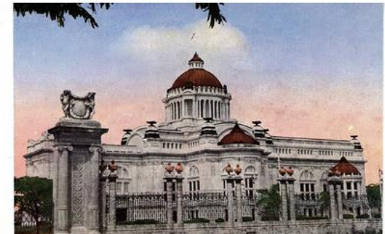
人民議會議事堂（泰國）

絵葉書をはじめ、ポスター、伝単、絵画、写真などの図画像資料は、歴史資料として高い有用性を持つ。いうまでもなく、絵葉書は、きわめて20世紀的なメディアといえる。写真や絵画、デザインといった素材を中心とした、ビジュアルな媒体だと思われがちだが、文字や記号、ときにはイギリスのデッカ・レコード社が受注販売しているポストカードレコードのような音絵葉書、さらには動きを取り入れた遊ぶ絵葉書など、メディア・ミックス的な印刷メディアであった。今日も多くの絵葉書愛好家が存在することからわかるように、絵葉書は受け取り手のイメージネーションをかき立てるメディアなのである。