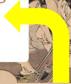
FIGURE 2 旅順ノ全景 Ryojun no zenkei Unidentified Bird's-Eye View of Port Arthur, 1905 Postcard

in the postwar period, supported by the continued fervent collection of the postcards in Japan. 14 The Yomiuri shinbun dated May 13, 1906, reported that the number of postcard stores had expanded by about four thousand. Even some secondhand bookstores and woodblock print stores abandoned their old businesses and entered this market. The types of war-related media evolved over time.