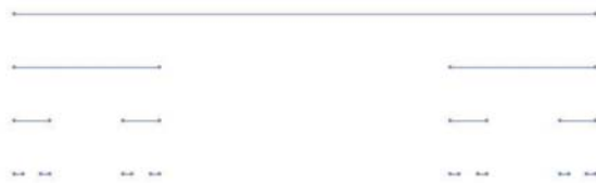
図 1. L_{0,1}(\lambda) の構成段階