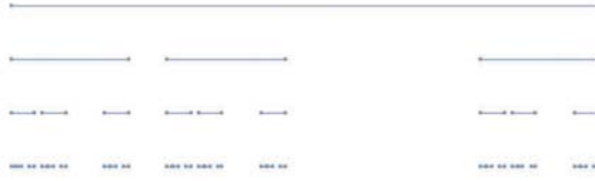
図 3. L_{0,1,3}(\lambda) の構成段階