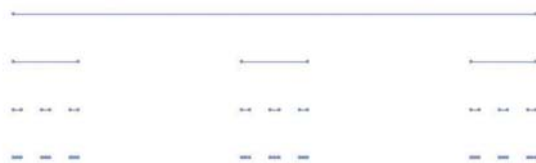
図 2. L_{0,1,2}(\lambda) の構成段階