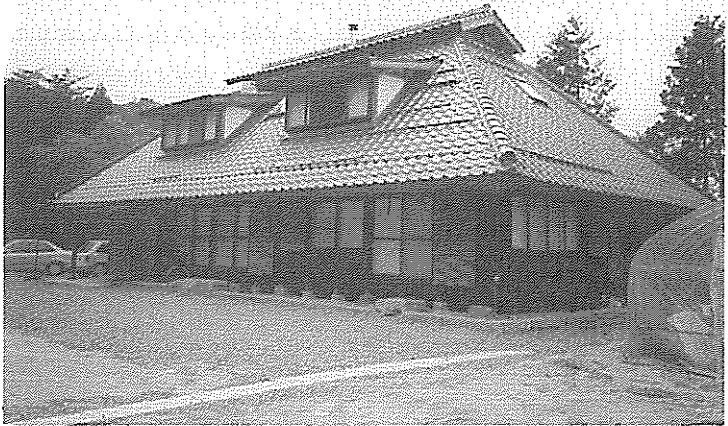
写真1 かやぶきの形をしたわが家 (古民家再生工房 萩原義郎氏撮影)

2、I村の (編)1割以上も新規就農の家があるということは、かなり特別な集落のよう こと