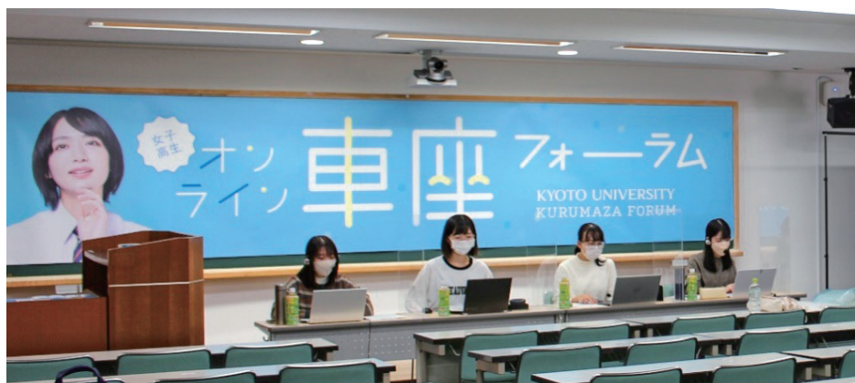
保護者交流会の様子

https://www.cwr.kyoto-u.ac.jp/rooting/kurumaza/