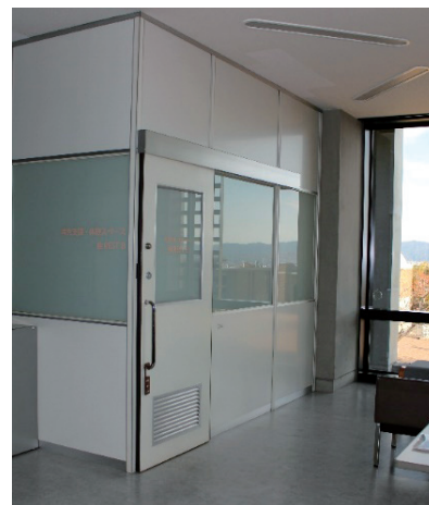
「桂 REST B」外観