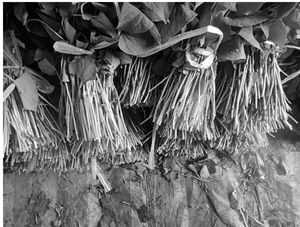
写真3 ヴィンロン省ビンミン市で出荷用に束ねられたドクダミ 出所：筆者撮影（2018年9月）.