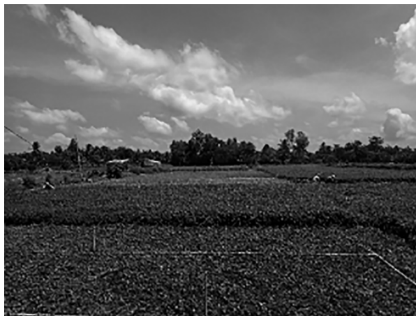
写真 1 ヴィンロン省ビンミン市におけるドクダミ栽培の様子

ビンミン市は現在、チャビン省など周辺の市場において、ドクダミ栽培が盛んな村として知られている（写真 1）。かつては、ホーチミン市に向けて乾燥したドクダミを販売していたが、現在では、周辺の市場への販売が拡大したり、生食用のドクダミも販売したりするようになるなど、その販売先や用途は拡大している。栽培方法も集約化が進み、スプリンクラーによる灌水だけでなく、化学肥料の施与や農薬の利用も一般的になってきた。ヴィンロン省の統計資料によれば、2017 年のビンミン市における農作物作付面積は、水稲（8,551 ヘクタール）、クレソン（1,567 ヘクタール）に次いでドクダミやミント類（1,091 ヘクタール）が多い [Cục thống kê tỉnh Vĩnh Long 2018]。ビンミン市のドクダミ栽培農家によれば、クレソンや柑橘類などの他の作物に比べて、ドクダミ栽培は、求められる技術が高くなく初期投資が少なくすむため、参入が容易だという。ドクダミ栽培専用のスプリンクラーや、籾殻を焼いた灰を用いて酸性土壌を中和する技術が開発されるなど、ビンミン市はドクダミの生産地として有名になった [小坂・古橋 2021]。