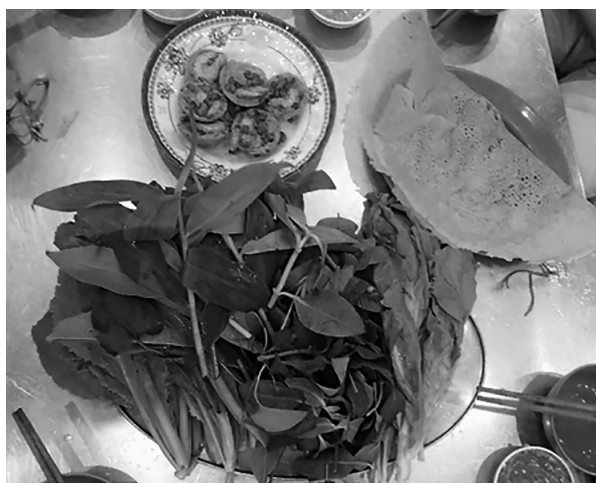
写真 4 Bánh xèo に添えられたドクダミを含む薬味野菜

注) ベトナムで生食したドクダミは、日本のものより葉の厚みや色が薄く、においも弱いと感じられた。