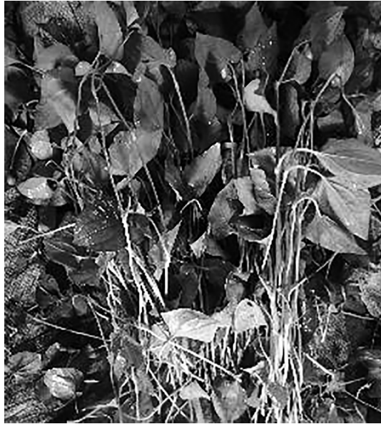
写真2 ヴィンロン省ビンミン市で販売用に栽培され収穫されたドクダミ.