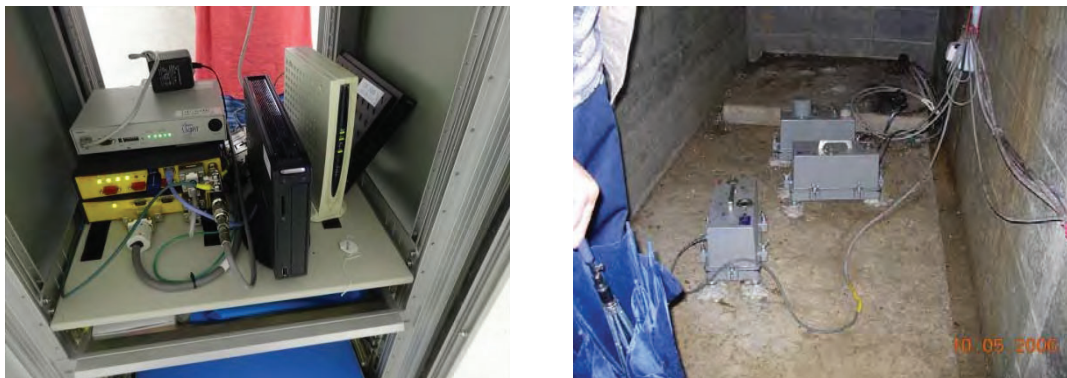
Figure 2 観測システム(左がロガー、右が地震計)

観測システムを Figure 2 に示す。各観測点には、地震計、ルーター、ロガー、電源制御装置と UPS が設置されている。電源制御装置は、機器が操作不能になったときに強制的に電源を切断・復電するものである。