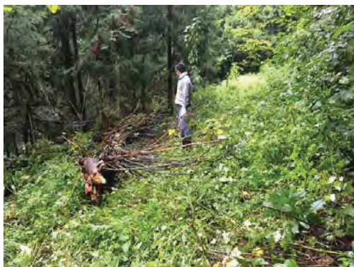
Figure 3 観測点への道

毎日宇治の受信システムで地震のデータが届いているかどうかの確認とデータが良好であるかどうかの確認を行っている。問題があったときは、その観測点へ公用車で向かう。一番遠い宿毛(高知県)に行くには約6時間かかる。途中で高速がなくなるからであるが、高速道路は整備中でもう何年かすれば現地まで届くことが期待されている。データは気象庁とも相互利用しているのでデータの欠測があれば、直ちに気象庁から連絡がある。機器の交換に伴うパラメータ変更なども、関係者に連絡を行う義務がある。