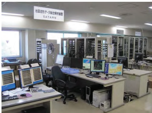
Figure 4 サーバルーム

は、外付け 3TB のハードディスクに約 1 ヶ月半間のデータとして保管している。データは従来いろいろなメディアで保管されてきた。ここ 20 年前では、Exabyte (8mm ビデオテープ) と DAT が使われてきて、約 10 年前から HDD が主体となった (Figure 5)。Exabyte や DAT はテープなので劣化が進むと、磁性体が酸化して再生できなくなる。