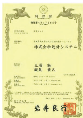
Figure 7 特許証

センターでは、新しいことにチャレンジするために日々技術革新が求められる。計測器の開発に従事することが出来たり、業務を簡便化するためのシステムを構築する必要に迫られたりすることがある。前者では特許を取得する機会があり、後者では、業務の進捗が効率的になるので、日々の仕事に余裕が出てくる。