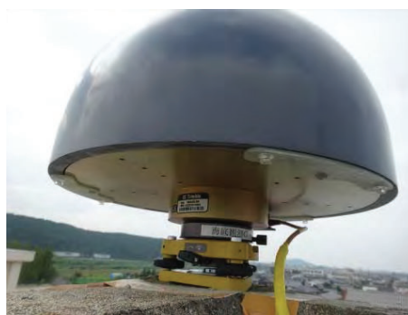
Figure 6 海底地震観測(左) と GPS 地殻変動観測(右)

最近では、海域の地震観測のため長期間船に乗ったり、静的な地殻変動を捕らえるために GPS を使った観測を定期的に行う観測を行ったりしている (Figure 6)。海底地震観測では、長期間の船上生活をするようになる。船酔いと天候との戦いで業務以前に体調管理が必要となってくる。GPS 地殻変動観測では、設置面に対し仰角 10 度以上に障害物があると正確な観測が期待できないので、高層建築物の屋上での設置作業と