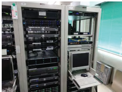
Figure 5 データの保管

また、再生用の機械システムも販売停止となるので、その前にデータを新しいメディアに移し変える作業がある。Exabyte で記録されたテープはすでに酸化が進んでおり、半分程度のデータが再生できなかった。HDD も長期間電源を通さずに保管しておくと故障の原因となることが言われており、新しいメディアへの転換が望まれるが、時間と手間のかかる作業だけに人員数が少ない現状では難しい問題である。最近テープの劣化の原因であった酸化が抑えられる素材の開発が進み、新しいシステム (LT0) が販売されだしたので、事前テストを行った。この機械が導入されれば、現状よりビット単価が安く、またサイズも小さく保管性も優れているので効率が上がることが期待できる。