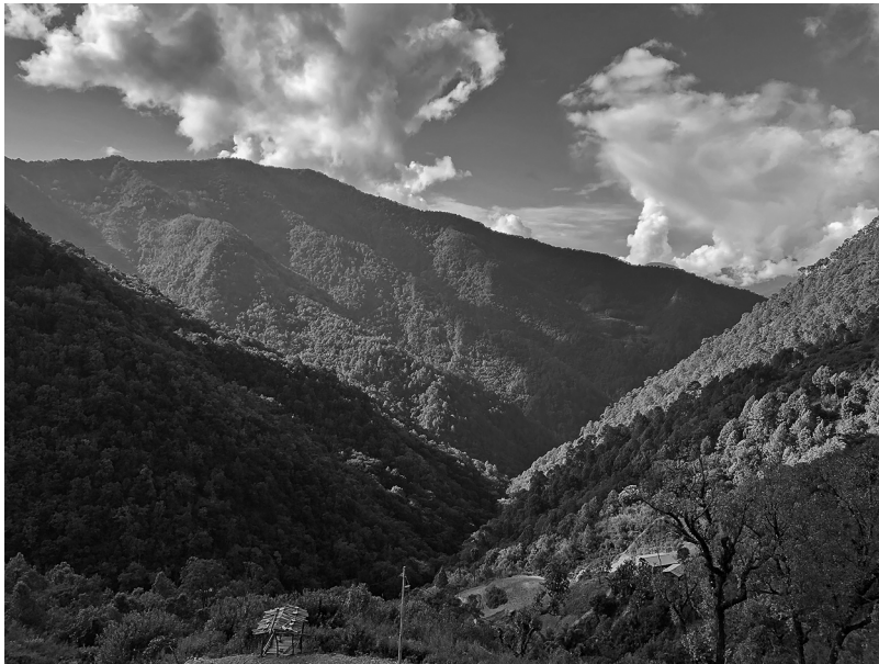
写真1 フラン・フラン・ゼイ

また、リダム期間外にはフラン・フラン・マのポダンである崖の周辺部を除いては、フラン・フラン・ゼイ内への立ち入りは許されているが、いくつかの禁忌が設けられている。たとえば岩の移動、投石、叫喚、豚／卵／玉ねぎの摂食、性行為などである。これらの禁忌を破るとフラン・フラン・マの怒りを買うとされ、病や失踪、暴風雨、最悪の場合には死といった災いが禁忌を破った本人だけでなくその家族や村全体に降りかかるとされている。 21) このフラン・