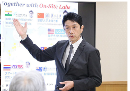
拠点の概要を説明する上杉拠点長