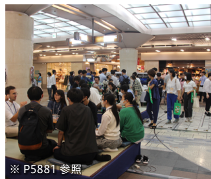
※ P5881 参照