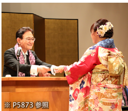
※ P5873 参照