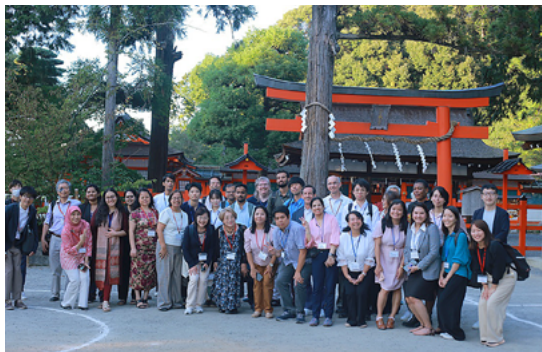
吉田神社ウォーキングツアーにて

アジア研究教育ユニットでは、引き続き次世代の研究者が英語での学術交流が行いやすい環境づくりに尽力し、本ワークショップをきっかけに、多くの若手研究者が世界に羽ばたいていくことを期待しています。