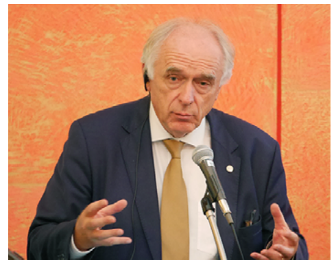
カバット事務局長による説明