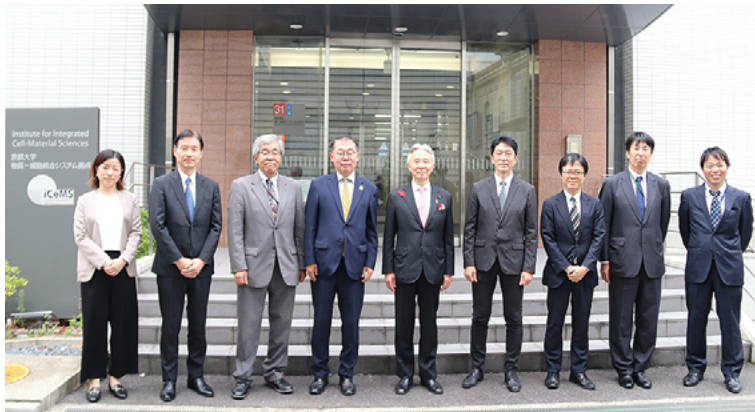
盛山大臣と文部科学省、 iCeMS 関係者

視察を終え、盛山大臣は、文部科学省による基礎研究振興の重要性について言及し、大学を後にされました。