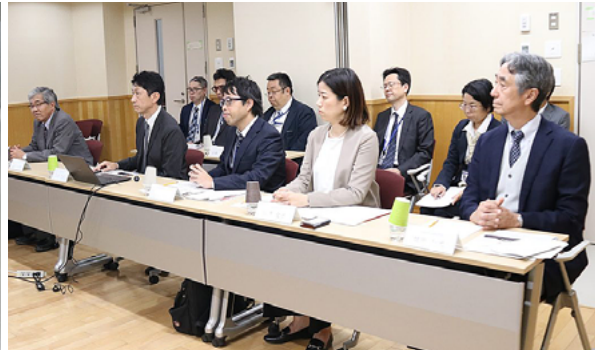
iCeMS および本学側の参加者