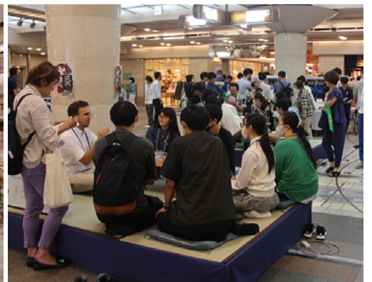
ちゃぶ台囲んで膝詰め対話