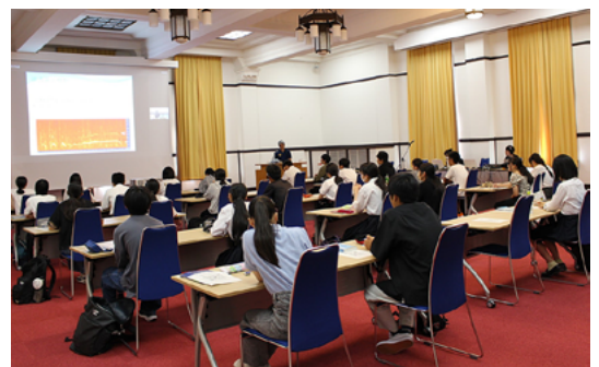
【講義型】「人魚の歌声～音を使ってジュゴンの秘密を解き明かす～」

【講義型】は、延べ約840名の申込者を対象に、対面とオンラインで実施されました。教員は、附置研究所・センターで高度な研究活動を展開する研究者らが担当し、