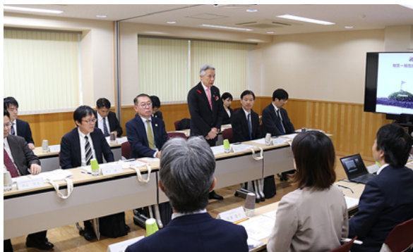
挨拶される盛山大臣