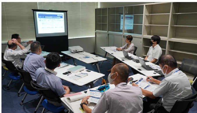
意見交流会の様子