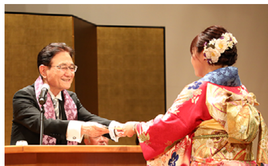
学位記授与の様子