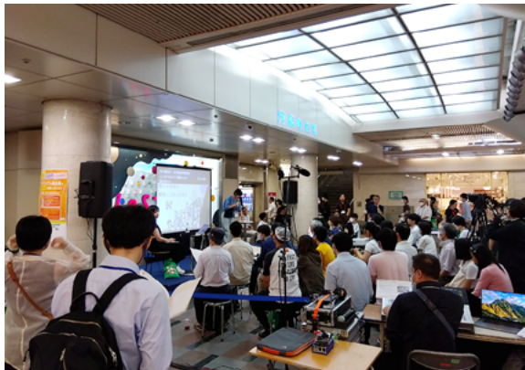
お茶を片手にトーク◎トーク