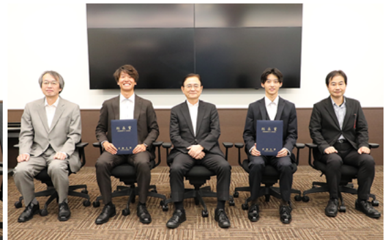
受賞者および関係者