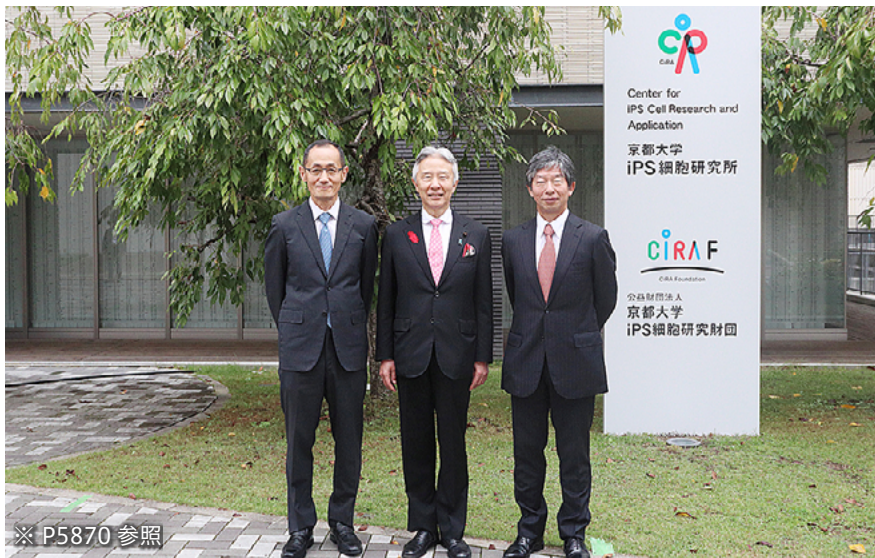
※ P5870 参照