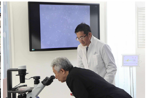
ナイーブ型 iPS 細胞を観察される盛山大臣 (説明者は高島准教授)