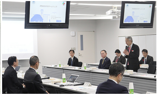
意見交換会の冒頭で挨拶される盛山大臣