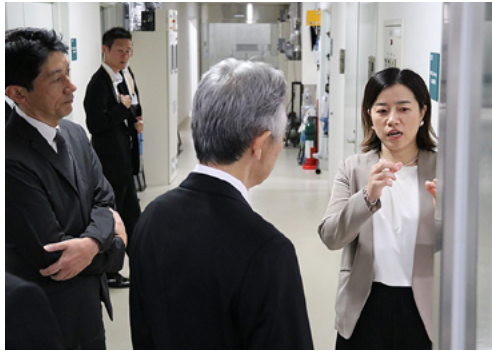
研究設備の案内をする深澤副拠点長