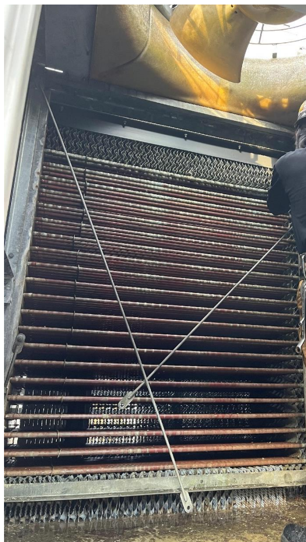
図5. 充填材を取り外して銅管コイル周辺の点検等をしている様子

等の都合でスケジュール調整が難航したが、10月25日(水)に交換工事を実施した。同日に、経年的に劣化していたエア抜き弁の交換や充填材をすべて取り外しての銅管コイルの点検作業もおこなった(図5)。寒波到来から半年以上も大きな問題なく冷却水を循環できていたのでコイルに問題はないと予想してはいたが、実際にコイルに破損や漏水等の問題がないことを業者殿に確認して頂いて安心できた。充填材は、経年的にカルキ等が付着している可能性があったため取り外した際に高圧洗浄して頂き、あまり劣化が進んでいないということで再度取り付けた。散布水を溜めている密閉式冷却塔の下部水槽には経年的にヘドロ等が堆積し、普段から数年ごとに高圧洗浄のメンテナンスを業者殿にお願いしている。この時にも堆積物が溜まっており、また、充填材の脱着の際にカルキ成分等が落下した可能性があったため、充填材を取り付けた後に下部水槽も高圧洗浄して頂いた。