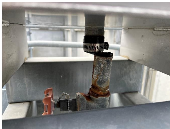
図4. 折損した膨張タンク下部配管

ったことから、液化運転の際に冷却水量が不足したと考えられた。銅管コイルの破損の有無については、この時点では分からなかった。