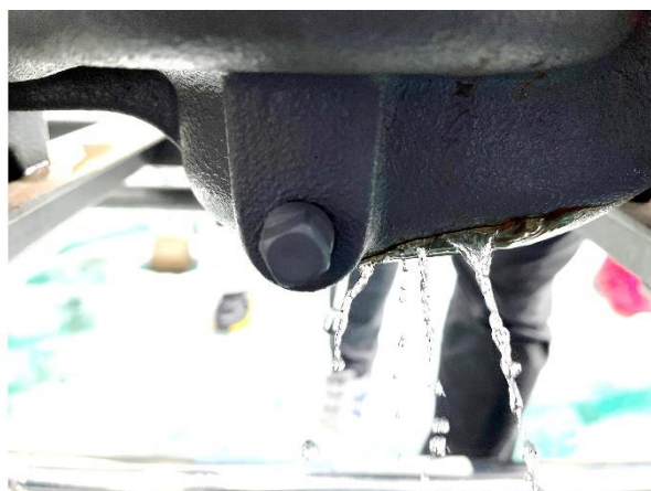
図3. 散水ポンプのケーシングの亀裂から散布水が漏れている様子

1月26日(木)の午後7時頃に液化運転を中止して密閉式冷却塔を確認したところ、以下の問題が発生していることがわかった。まず、散水ポンプのケーシングに亀裂が入っており、散布水がそこから漏れていた(図3)。また、凍結防止ポンプが破損しており、冷却水がそこから漏れていた。さらに、保温とラッキングがなされていたものの、上水道から膨張タンクおよび下部水槽へ給水する水道管が凍結しており、不足した水を補えなかった。散水ポンプおよび凍結防止ポンプについては、ポンプ内に残っている水が凍結して氷になったときの体積膨張で破損したか、あるいは、凍結している状態で無理に稼働させようとしたときに破損したか、のどちらかであろうと考えられた。図1に示すように、凍結防止ポンプは冷却水配管にバイパスして設置されているので、この凍結防止ポンプが破損したことで冷却水が漏れて減少し、上水道の水道管の凍結により給水もできな