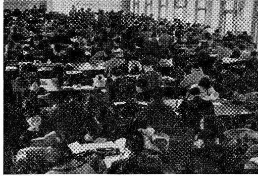
人・人・人……学年末試験のころ

すでに図書館や学生控室での掲示で、ご承知のことと思いますが、経済学部の学生諸君が学部所蔵の図書を利用する方法が、この4月から変わりました。附属図書館を通じて借り出す従来の方法を改め、学部閲覧室（法経新館2階西側）において直接取り扱うことになりました。