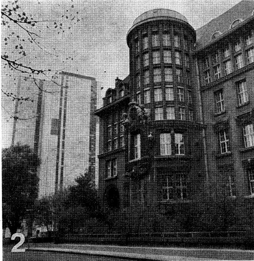
図2 旧館（右側）と新館（左側奥）