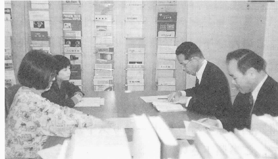
薬学部図書室見学