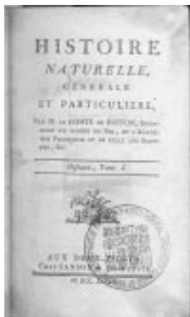
図1. 第1巻の扉。1785年刊とある。本のサイズは10.0×16.5×5.0-6.0cm。