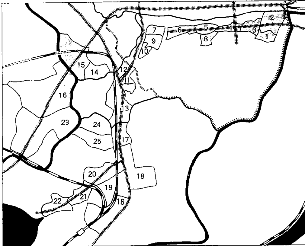
図3 京城の金属機械工業地帯