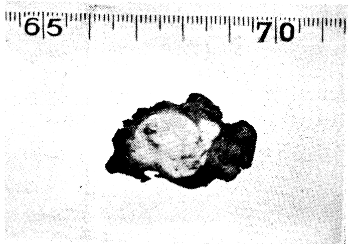
→ 第4圖 【説明】 術後6ヶ月、経過順調 の結核腫。 25才の女子、右上葉肺尖下枝 剔除された結核腫