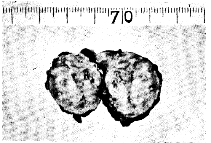
↑ 第3圖 【説明】 術後8ヶ月、経過順調。 22才の男子、右上葉水平枝の結核腫。