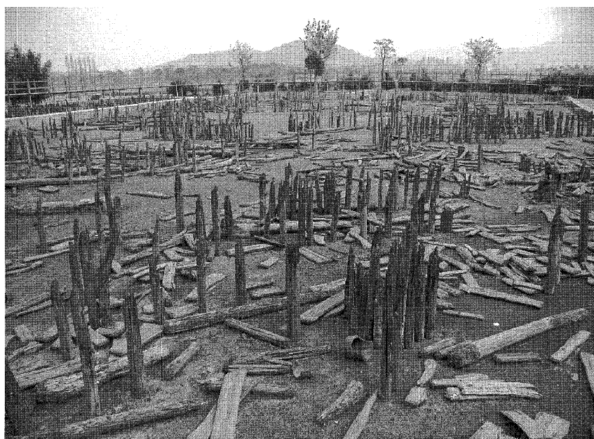
図1 河姆渡遺跡 高床式住居に用いられたと考えられる土台柱

河姆渡 (ホムドウ) 遺跡は図1に見られるように1メートル余りの無数の木杭が林立していた。これはレプリカであり、実際の杭はすべて取り上げられ、浙江省博物院に保管されていると聞く。これは復元すれば高床式の住居となるが、そういう住居の土台を支える柱であったようである。