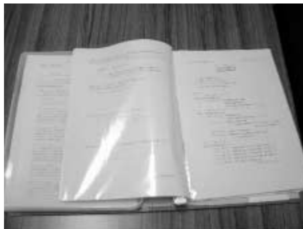
写真3 2002年度学び探求編の授業で用いたポートフォリオファイル