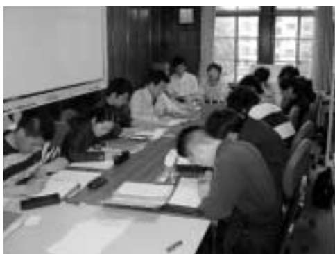
写真6 リフレクションシートに記入している様子