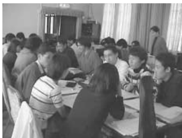
写真1 グループ・ディスカッションの風景