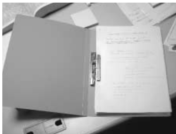
写真2 リフレクションシートへの記入（左）とそれをはさむポートフォリオファイル（右）