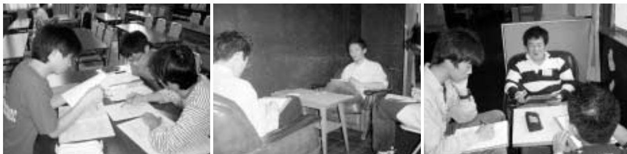
写真5 グループ・ディスカッション